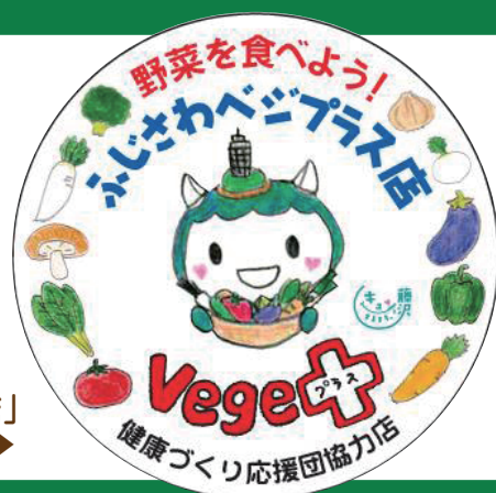
「ふじさわベジプラス店」ステッカー▶