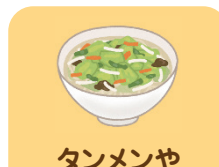
タンメンや中華丼など単品